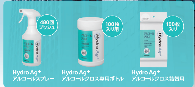
Hydro Ag + アルコールスプレー