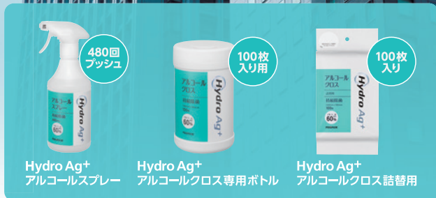
Hydro Ag+ アルコールドレスプレー